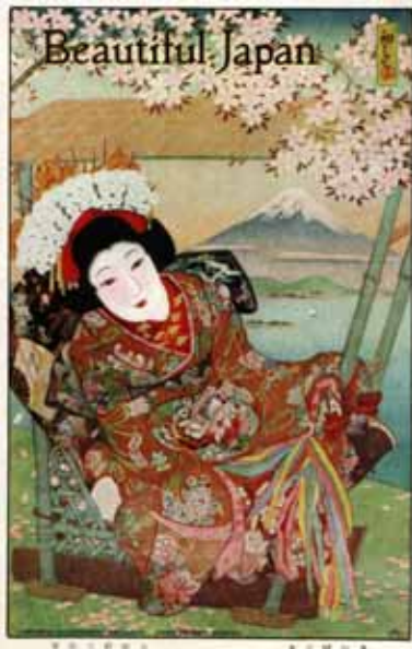
Beautiful Japan 1930